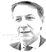
Giuseppe Conte. Presidente del Movimento 5 Stelle

«Transizione 5.0, il Governo fa perdere tempo alle imprese»