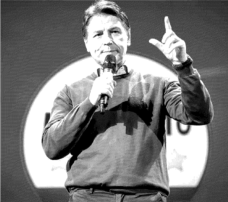
Giuseppe Conte. Presidente del M5S ed ex presidente del Consiglio (da giugno 2018 a febbraio 2021)