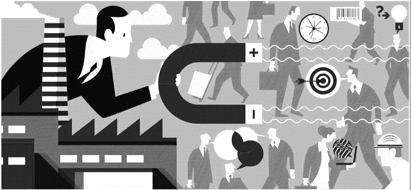
ILLUSTRAZIONE DI SANDRA FRANCHINI