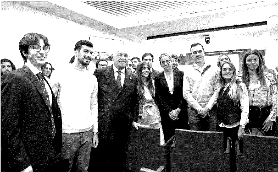
Prima lezione. Il ministro della Giustizia Carlo Nordio insieme a un gruppo di allievi della Scuola nazionale del notariato