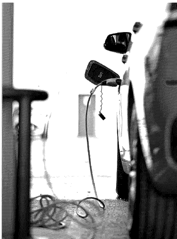
Caro prezzi. in Italia le ricariche pubbliche sono costosissime

SERVE RIFORMULARE GLI INCENTIVI SMART, RIDURRE IL COSTO DELL'ELETTRICITÀ, RAZIONALIZZARE RETE E MERCATO DELLE RICARICHE